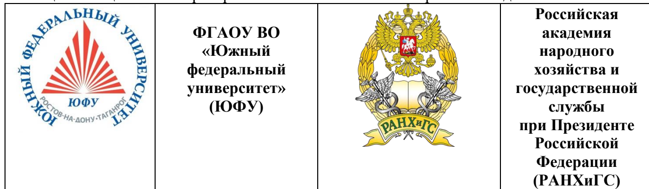
Таблица 7 - Социальные партнеры МАОУ «Школа № 115» в решении задач воспитания:

Мы радуемся победам и приумножает их возводя в ранг достояния и фундамента успешного будущего учеников школы.