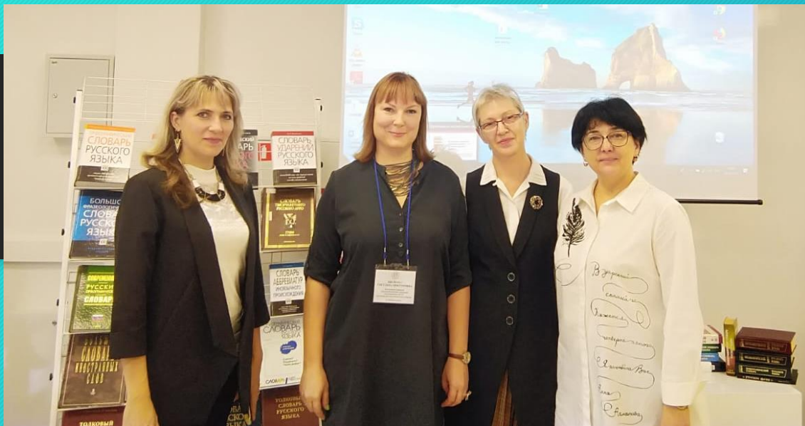
Семинар по вопросам проверки ВПР