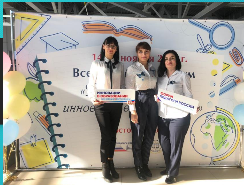
Форум «Педагоги России»

В течение учебного года проведено 4 семинара при участии 218 педагогов школы и Советского района