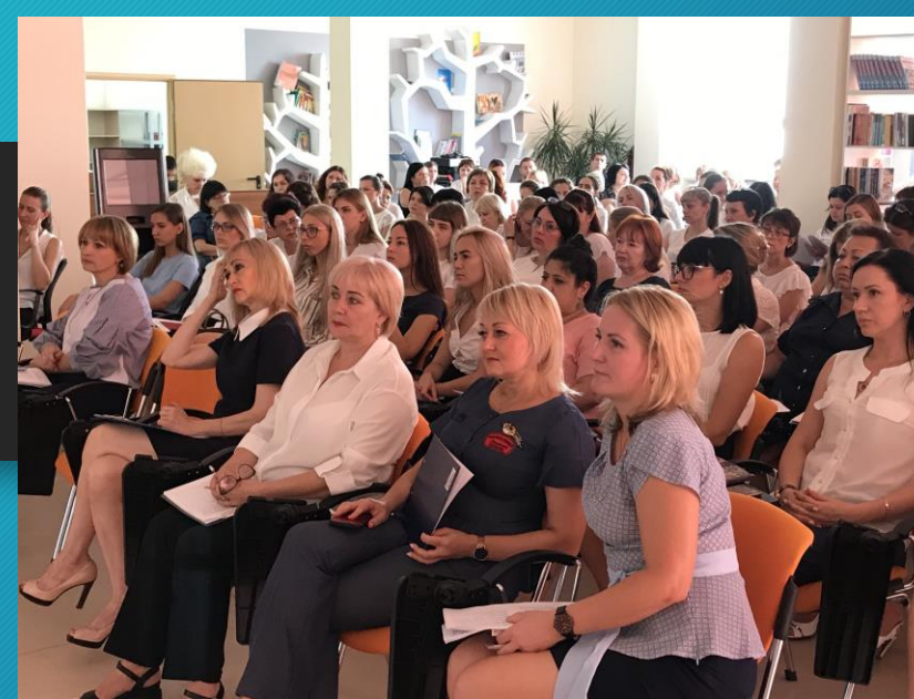
Регулярные семинары в рамках проекта «Школа молодого специалиста»