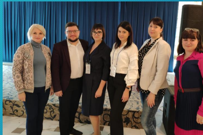
В течение учебного года 97 педагогов школы посетили мастер-классы, семинары, курсы